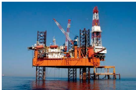
日本海洋掘削が運用する海上リグ「SAGADRIL-1」

そのほか、SingTelにはWAN環境全体の運用や構築もサポートしてもらっています。