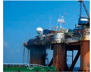
「NAGA1」に設置されている 通信用アンテナ

通信速度は512kbpsです。インマルサットの時と比べると数倍の帯域になりました。SingTelのMVSATでは2Mbpsまでサポートされているので、もう少し速い回線にしたいという思いもありますが、当社の場合、5カ所のリグを接続しなければならないので、現在はすべてのリグで512kbpsのサービスを利用しています。